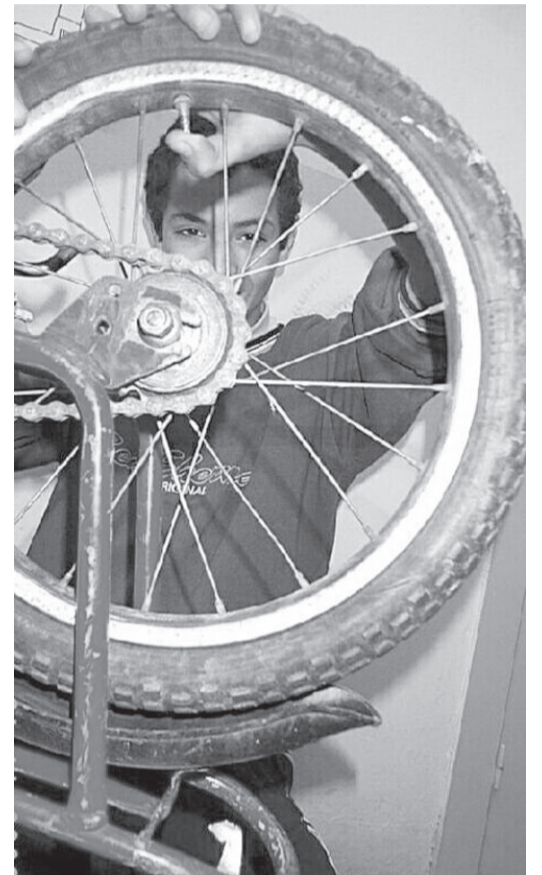
En un dels tallers de Cintra els joves aprenen a reparar bicicletes.